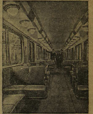
На снимке: внутренний вид вагона

В ближайшее время по линии 3-й очереди метрополитена имени Л. М. Кагановича будет эксплуатироваться новый поезд, выпущенный Мытищинским вагоностроительным заводом.