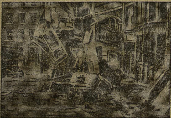
Разрушения на улицах Лондона в результате бомбардировки германской авиацией.